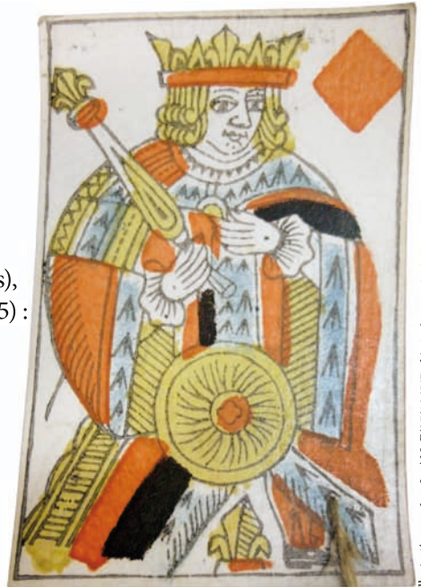
Illustrations p.1 et 3 : AN, F/17/1065/B, dépôt de Monthul (Ain) ; Conception graphique : IRHT-CNRS