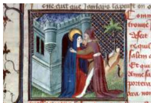
Besançon, B.m., ms 550, fol. 54 Première moitié du XV e siècle

Toutefois, ce thème iconographique n'est pas sans ambiguïté. Jean Molan, théologien de la contre-Réforme 3 pense que la Rencontre à la Porte Dorée est abusivement considérée comme le moment et le Baiser le moyen, de la conception de la Vierge : « sa conception par un baiser est une fable et l'obscur fiction de certains ». En effet, cette image ne doit pas être systématiquement interprétée comme immaculiste. La connaissance du contexte est nécessaire pour en préciser la nature et l'interprétation théologique