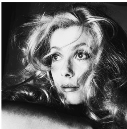
Catherine Deneuve, actrice, Los Angeles, 22 septembre 1968