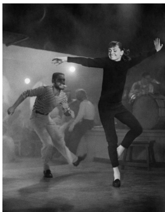
Audrey Hepburn, actrice, sur la plateau de Funny Face , Paris, 1956