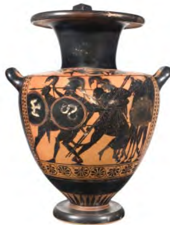
Hydrie à figures noires, Guerriers , attribué au groupe de Léagros, Athènes, 550-500 av. J.-C. BnF, dép. des Monnaies, médailles et antiques

Les motifs des vases sont créés par le contraste entre le beau vernis noir brillant et la couleur rouge de l'argile ; pour créer cela, seuls des matériaux minéraux étaient utilisés. Une cuisson complexe en trois étapes alternait l'ouverture et la fermeture du four, permettant aux parties couvertes d'un lait d'argile de devenir un « vernis » très résistant. Les premiers vases avaient des figures noires sur un fond ocre ; vers 530 avant J.-C., les Athéniens ont inversé le processus, avec des figures rouges sur fond noir, et des ajouts de détails peints comme les traits du visage ou la musculature.