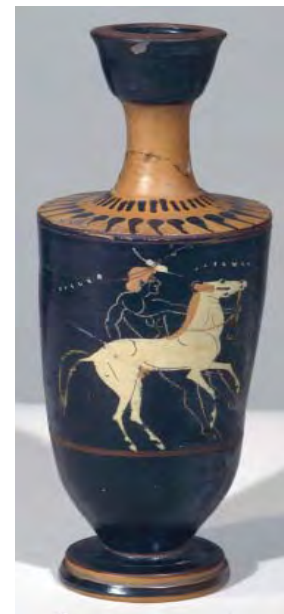
Lécythe à décor surpeint, Apobate (athlète), attribué au peintre de Diosphos, Athènes, fin du VI e siècle av. J.-C. BnF, dép. des Monnaies, médailles et antiques

Un petit lécythe au décor particulier gravé et peint par-dessus le vernis noir (technique dite de Six) montre un athlète tenant deux javelots derrière un cheval cabré : il s'agit d'un apobate, athlète en armes qui fait des exercices de voltige dans les jeux.