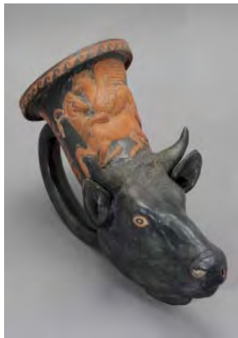
Rhyton en forme de tête de bœuf, Apulie, IV e siècle av. J.-C. BnF, dép. des Monnaies, médailles et antiques

Les Athéniens se retrouvent le soir au banquet pour partager le vin dans une atmosphère festive; chants, danses et jeux font partie des réjouissances, comme la déclamation de poésie ou les discussions philosophiques. Seuls les hommes y assistent, servis par des esclaves, des musiciens ou des hétaires (courtisanes).