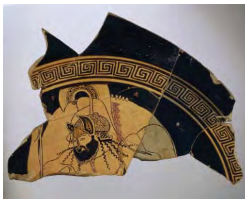
Coupe à figures rouges (fragment), Ajax portant le corps d'Achille , attribué à Douris, Athènes, vers 480 av. J.-C. BnF, dép. des Monnaies, médailles et antiques

Sur un fragment de coupe attribué à Douris, on découvre par exemple le héros Ajax, la tête recouverte d'un casque à haut cimier d'où s'échappent de manière très graphique de longues mèches de cheveux, portant le corps mort de son compagnon Achille.