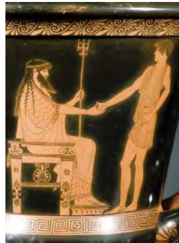
Cratère attique à figures rouges (détail), Poséidon et Thésée , attribué au peintre de Syriskos, Athènes, vers 480 av. J.-C. BnF, dép. des Monnaies, médailles et antiques