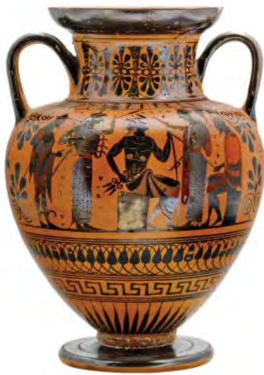
Amphore à figures noires, Assemblée des dieux , attribuée au groupe de Trois lignes, Athènes, 530-520 av. J.-C. BnF, département des Monnaies, médailles et antiques/ CNRS- Maison Archéologie & Ethnologie René Ginouvès

Un grand cratère, retrouvé intact à Agrigente, en Sicile, présente ainsi le dieu des mers Poséidon, reconnaissable à son trident, trônant majestueusement face au héros Thésée.