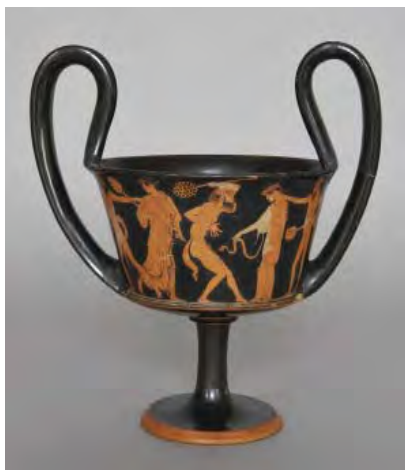
Canthare à figures rouges, Satyres et ménades , attribué au peintre de Penthésilée, Athènes, 470-450 av. J.-C. BnF, dép. des Monnaies, médailles et antiques

Dionysos, dieu du vin et d'ivresse, du théâtre et de l'illusion, est omniprésent sur les vases destinés majoritairement à la consommation du vin. Il avance entouré d'un joyeux cortège, le thiasos , où évoluent les ménades et les satyres, mi-hommes mi-chevaux. Tous goûtent aux plaisirs de l'ivresse, des rencontres, de la musique et de la danse, dans une frénésie qui peut parfois devenir sauvage.