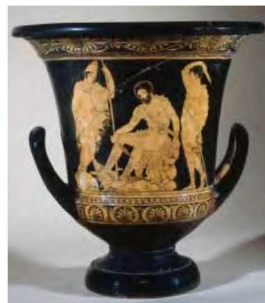
Cratère lucanien à figures rouges, Ulysse consultant l'ombre de Tirésias , attribué au peintre de Dolon, Métaponte, 390-380 av. J.-C. BnF, dép. des Monnaies, médailles et antiques

Le duc de Luynes n'a rassemblé que quelques vases produits hors d'Athènes, dans des ateliers fortement influencés par le principal centre de production. Ils ont été choisis pour leur qualité exceptionnelle : le grand cratère lucanien avec Ulysse évoquant les mânes de Tirésias et le jugement de Pâris au revers figure, entre autres, parmi les céramiques grecques les plus connues au monde.