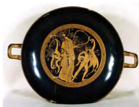
Coupe à figures rouges, Dionysos musicien et satyres , attribué au peintre de Brygos, Athènes, vers 480 av. J.-C. BnF, département des Monnaies, médailles et antiques