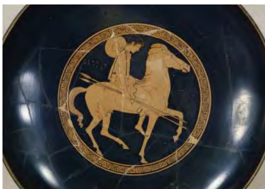
Coupe à figures rouges, Jeune cavalier , attribué au peintre de Penthésilée, Athènes, 470-460 av. J.-C. BnF, dép. des Monnaies, médailles et antiques

La guerre est un univers spécifiquement masculin : le citoyen athénien est d'abord un soldat qui se bat pour sa cité et la défend dans les conflits omniprésents du monde grec. L'habillement des guerriers, leur départ ou les combats sont souvent évoqués par l'iconographie des céramiques.