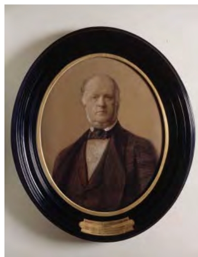
Sébastien Cornu, Portrait du duc de Luynes (1802-1867) BnF, dép. des Monnaies, médailles et antiques

Cet aristocrate a eu une riche carrière politique, associée à beaucoup d'activités, mais sa véritable passion était l'Antiquité, son histoire et son archéologie dont il est devenu un spécialiste reconnu. Il a participé activement à la naissance d'une archéologie scientifique en Europe, finançant revues et publications. Ses moyens lui ont permis d'accumuler une incroyable collection de statues, céramiques, gemmes, bijoux, monnaies antiques ... A la fin de sa vie, après la perte de son épouse, il se détache de cette collection et la donne au « Cabinet des Médailles » de la Bibliothèque Nationale pour que chacun puisse l'admirer auprès des collections royales.