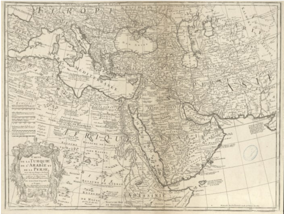
« Carte de la Turquie, de l'Arabie et de la Perse où se voit tout l'Empire des Turcs. Dressée sur les Mémoires les plus récents rectifiés par les Observations de Mrs de l'Académie Rle des Sciences, par G. de l'Isle Géographe. » éditée par Dezauche, Paris, 1780 .